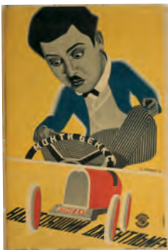
Hermanos Stenberg, Vladimir (1899-1982) y Georgii (1900-1933) Un verdadero caballero (1928) The Merrill C. Berman Collection, Nueva York

XIX y comienzos del XX. El segundo, se ocupa del período de entreguerras, considerado la época estelar del cartel en Europa, con nombres de autores relevantes como Cassandre, Paul Colin, Jean Carlu, Herbert Bayer y Otto Baumburger, entre otros. Un tercer apartado se centra en las propuestas de vanguardia, en los carteles de algunos artistas adscritos a los movimientos modernos como el constructivismo, el futurismo, el surrealismo o las propuestas creadas en la Bauhaus alemana. Hay que destacar que la muestra incluye carteles de Vladimir Lebedev,