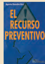
EL RECURSO PREVENTIVO Agustín Gonzales Ruiz FC Editorial 181 páginas

Economía política en libertad, El efecto Laffer y otras reflexiones, Ética en la libertad de los mercados, Sobre la población, la ecología y los recursos, son los cuatro capítulos que componen este ensayo que intenta desde la universidad aclarar algo sobre las causas profundas de la crisis y sus soluciones.