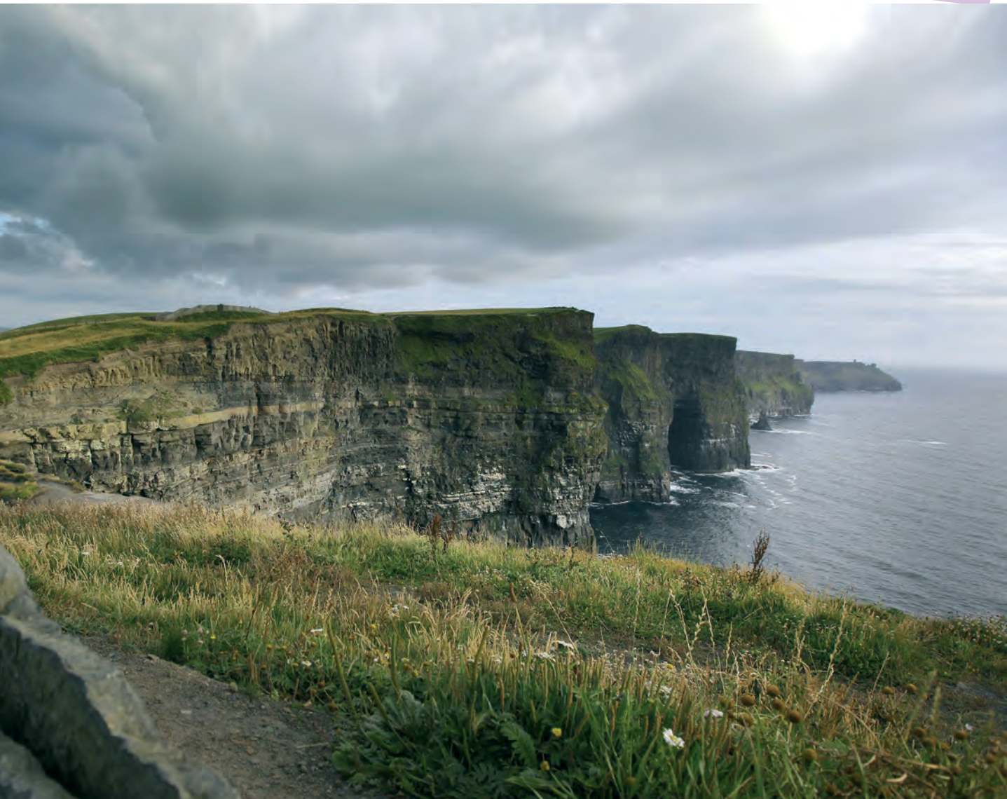
Acantilados de Irlanda

‘Excalibur’, rodada en los condados de Kerry, Tipperary y Wicklow; ‘La princesa prometida’, que inmortaliza los Acantilados de Moher, en el Condado de Clare, o ‘Once’, que encuentra en las calles de Dublín el escenario ideal para dar forma a una historia de amor entre dos músicos. Dramas, cintas épicas, romances... Todo es posible en Irlanda.