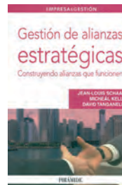
GESTIÓN DE ALIANZAS ESTRATÉGICAS AA.VV, Schaan, Kelly, Tanganelli Pirámide 187 páginas

Las alianzas estratégicas constituyen un instrumento importante que las empresas pueden utilizar para mantener y mejorar su competitividad en entornos altamente complejos y cambiantes.