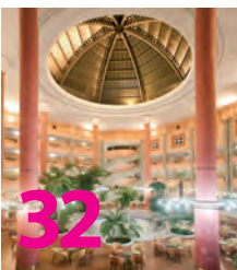
Hotel TRH Alcora