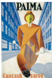
Róbert Berény (1887-1953) Palma kaucsuk sarok (1929) OSZK, Országos Széchényi Könyvtár, Budapest

XIX y comienzos del XX. El segundo, se ocupa del período de entreguerras, considerado la época estelar del cartel en Europa, con nombres de autores relevantes como Cassandre, Paul Colin, Jean Carlu, Herbert Bayer y Otto Baumburger, entre otros. Un tercer apartado se centra en las propuestas de vanguardia, en los carteles de algunos artistas adscritos a los movimientos modernos como el constructivismo, el futurismo, el surrealismo o las propuestas creadas en la Bauhaus alemana. Hay que destacar que la muestra incluye carteles de Vladimir Lebedev,