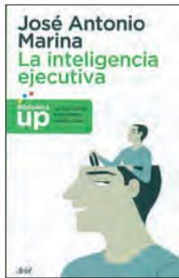
INTELIGENCIA EDUCATIVA José Antonio Marina Ariel Biblioteca UP

La nueva obra de Marina trata sobre la inteligencia ejecutiva o la fuerza centralizada que se encarga de dirigir todas las capacidades humanas. Un libro para padres, profesores o para sacarle cualquiera que quiera sacarle más jugo al conocerse a sí mismo