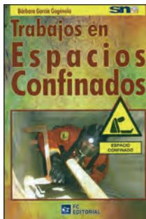
TRABAJOS EN ESPACIOS CONFINADOS Barbara García Gogénola FC Editorial 192 páginas

Espacio confinado es un espacio con abertura limitada de entrada y salida, ventilación natural desfavorable en el que puede acumularse contaminación ya que no está acondicionada para una ocupación continuada.