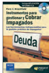
INSTRUMENTOS PARA GESTIONAR Y COBRAR IMPAGADOS Pere J. Brachfeld Profit Editorial 254 páginas

Espacio confinado es un espacio con abertura limitada de entrada y salida, ventilación natural desfavorable en el que puede acumularse contaminación ya que no está acondicionada para una ocupación continuada.