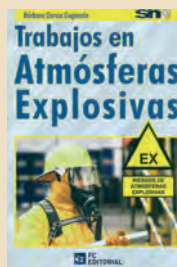
TRABAJOS EN ATMÓSFERAS EXPLOSIVAS Barbara García Gogénola FC Editorial 244 páginas

La mezcla con el aire, en condiciones atmosféricas normales, de sustancias inflamables en forma de gases, vapores, nieblas o polvos, en la que tras una ignición, la combustión se propaga a la totalidad de la mezcla no quemada es una atmosfera explosiva.