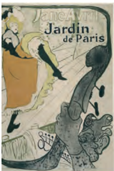
Henri de Toulouse-Lautrec (1864-1901). Jane Avril. Jardin de Paris (1893) Museum für Gestaltung, Zürich

A partir del próximo 18 de junio podrá visitarse en el Museo Picasso Málaga la exposición 'El Cartel Europeo, 1888-1938', una muestra en la que más de 180 obras de cerca de 90 autores muestran una cuidada selección de significativos carteles, según épocas. Exposición inédita en Málaga, está dedicada a las primeras eras del esplendor del cartel que se organiza en tres secciones correspondientes a periodos muy significativos. El primero está dedicado a la estética de los inicios del cartel con obras realizadas por Jules Chéret, Ramón Casas o Henri de Toulouse-Lautrec que decoraron Barcelona y París, dos ciudades que Picasso conoció bien, a finales del siglo