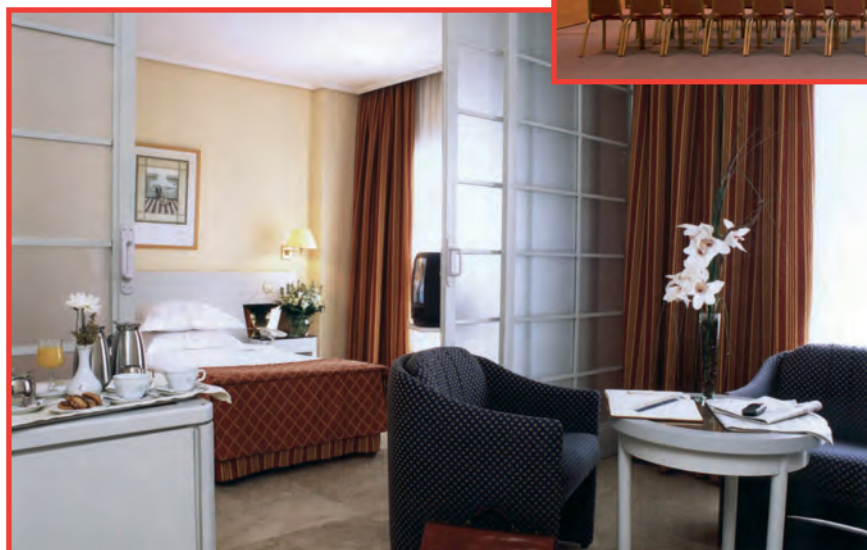
Imágenes del Hotel THR Alcora en Sevilla

el establecimiento regala un fin de semana para dos, en régimen de alojamiento y desayuno. Pero esta promoción especial, también válida para las reservas de empresa va más allá. En el momento en el que estos realicen individualmente una reserva, comenzarán a acumular puntos y, cuando se produzca la número diez, tendrá como premio un fin de semana para dos personas con alojamiento y desayuno.